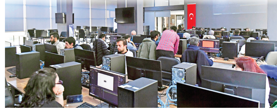
ABB Başkentlilerin kariyer yolculuklarına destek oluyor

HABER MERKEZİ ANKARA Büyükşehir Belediyesi Bilgi İşlem Daire Başkanlığı, Başkentli teknoloji severleri bilişim sektöründe geleceğin mesleklerine hazırlamak amacıyla ücretsiz yazılım ve dijital medya eğitimleri vermeye devam ediyor. Bugüne kadar 5 farklı branşta toplam 434 kişinin yararlandığı "Akademi Ankara" eğitimleri, 12. döneminde de yoğun ilgi görüyor. >> HABERİ 3'TE