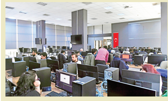
ABB Başkentlilerin kariyer yolculuklarına destek oluyor