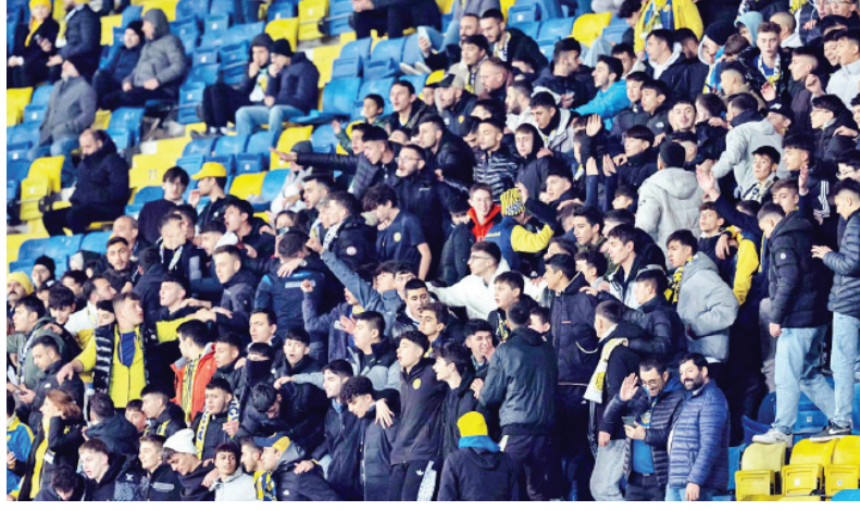
rada bulunan MKE Ankaragücü, 27 Nisan Pazar günü Eryaman

Kadın ve çocuk taraftarlara biletlerin ücretsiz olacağı ve bu biletlerin Passolig kartlarına Doğu Tribünü'nden yükleneceği kaydedildi. Ligde 39 puanla 18. sı-