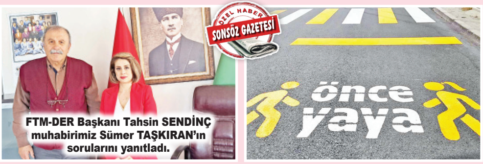
FTM-DER Başkanı Tahsin SENDİÇ muhabirimiz Sümer TAŞKIRAN'ın sorularını yanıtladı.