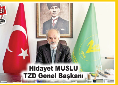
Hidayet MUSLU TZD Genel Başkanı