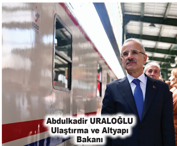
Abdulkadir URALOĞLU Ulaştırma ve Altyapı Bakanı

Bakan Uraloğlu, 2025'te Ankara Garı'ndaki törenle başlayan ilk organizasyonun 11 gün sürdüğünü ifade ederek, "Trenimiz, geçen yıl 12 merkezde 22 tiyatro oyunu sergiledi ve 4 bin 423 kilometre yol kat ederek sanatseverlerle buluştu." değerlendirmesinde bulundu.