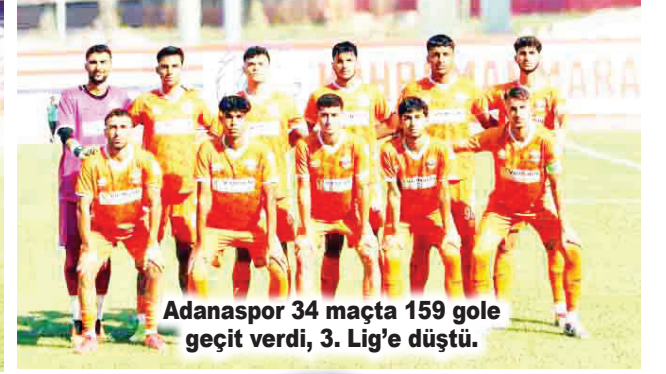
Adanaspor 34 maçta 159 gole geçit verdi, 3. Lig'e düştü.