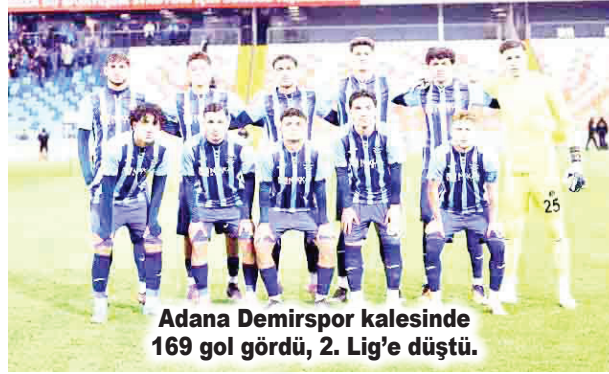
Adana Demirspor kalesinde 169 gol gördü, 2. Lig'e düştü.