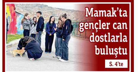
Mamak'ta gençler can dostlarla buluştu