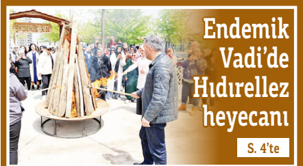
Endemik Vadi'de Hıdırellez heyecanı