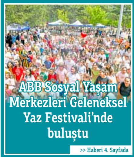
ABB Sosyal Yaşam Merkezleri Geleneksel Yaz Festivali'nde buluştu